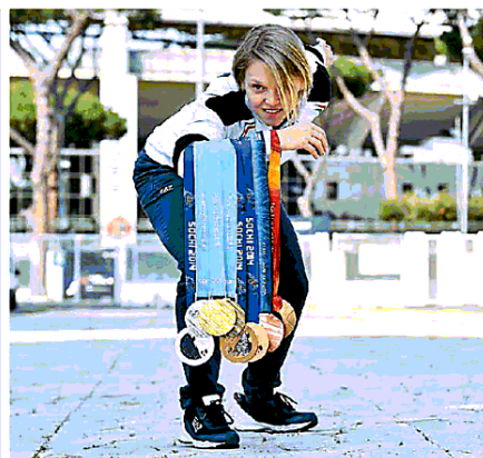
L'olimpionica Arianna Fontana è tra gli speaker

ma. La performance di dance ability del gruppo «Ottavo Giorno» chiuderà invece l'evento nella serata del 25 maggio. A partire dalle 15.30 Palazzo della Ragione si trasformerà dunque nello scenario di un evento dove passato e futuro, innovazione e tradizione, creeranno nuove sinergie all'insegna appunto della parola d'ordine della rinascita. Le direttrici artistiche Alice Neireide Cossa e Aisha Ruggieri, hanno posto l'accento sull'importanza dell'arte, coinvolgendo associazioni, giovani artisti e istituti come il Pollini che accompagneranno Tedx Padova 2019 durante un'intera settimana di eventi il cui filo conduttore sarà il tema dell'attesa. —